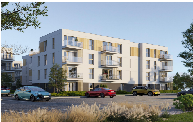
PARTER - BUDYNEK A