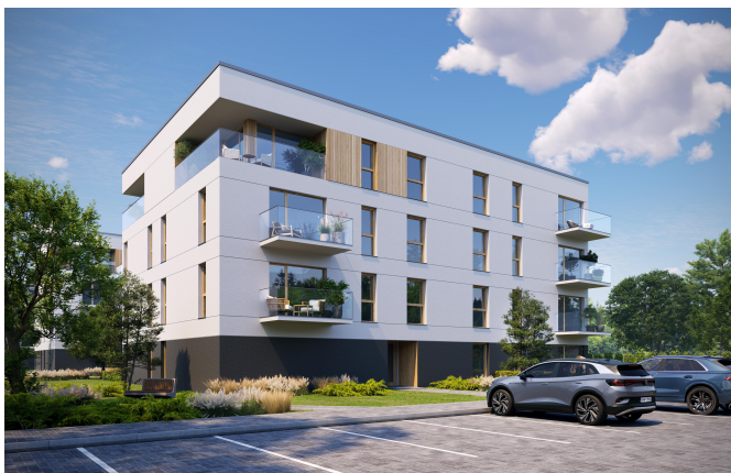
PARTER - BUDYNEK F